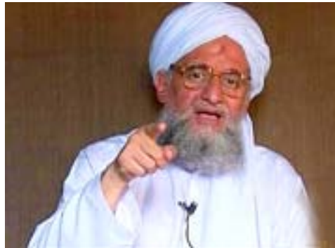
إنتاج أسلحة مناسبة لاسلحة الصليبيين الغربيين، بإمكاننا أن نهض أنظمتهم الاقتصادية والصناعية والقضاء على قوتهم

■ واشنطن/ا ف ب دعا الرجل الشافعي في تنظيم القاعدة إمين الظواهري إلى تنفيذ هجمات جديدة ضد الغرب - بعد عشر سنوات على اعتداءات ١١ سبتمبر، حسب ما أفاد المركز الأمريكي لمراقبة المواقع الإسلامية سايت. يشار إلى أن شريط الفيديو هذا الذي كانت مدته ٣٥ دقيقة هو الشافعي الذي بث في إطار سلسلة بعنوان رسالة أمل وأخبار سارة للشعب المصري، وقد أنتجته خلية الشباب التي تعنى بشؤون الاتصالات في تنظيم القاعدة، ولم يظهر في الشريط إلا صورة واحدة ثابتة للظواهري. وقال إمين الظواهري في هذه الرسالة إذا كنا غير قادرين على