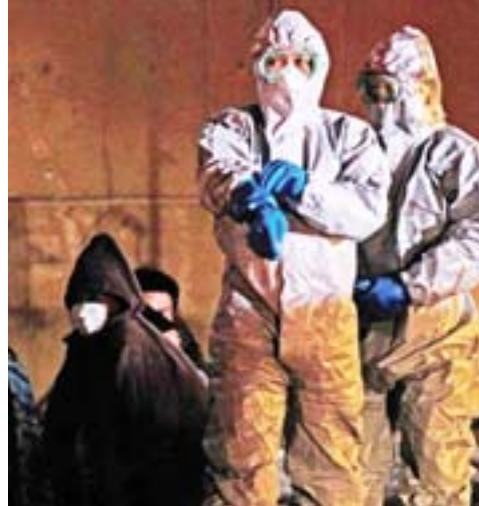
العمال في محطة فوكوشيما للطاقة النووية في اليابان.

● وكالات/ قالت السلطات الروسية أمس إن الانفجار الذي وقع في محطة فوكوشيما-١ للطاقة النووية في اليابان لا يشكل في الوقت الحالي تهديداً لأراضيها، وأن أي مواد مشعة ستحملها الرياح إلى المحيط الهادئ. وأكد مدير الدائرة الاتصالية الروسية للأرصاء الجوية المائية ورسد البيئة (روسيدروميت) الكسندر فركولوف في تصريحات لوكالة "انترفاكس" للأنباء إنه ليس هناك داع للذعر، مشيراً إلى أن مستوى الإشعاع لم يرتفع فوق الحدود المقبولة في أي من المناطق باقضى شرقي روسيا. وأعرب الرئيس الروسي ديمتري ميدفيديف عن تعازيه لليابان في ضحايا الزلزال القوي وتسونامي،