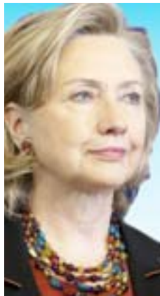
تؤدي هذه الأزمة المؤلة في الداخل إلى انسحابها من المسرح الدولي وتقلص مسؤولياتها الدولية.

وكان مسؤول أمريكي رفيع قد صرح أمس السبت بأن واشنطن