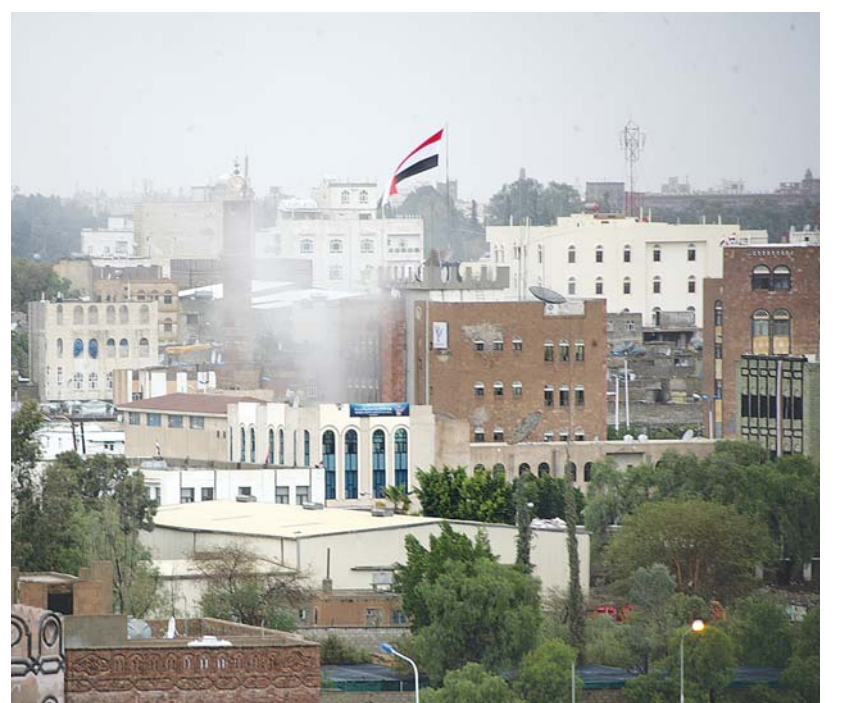
.. تدمير ٢ طوابق من مبنى وكالة سبأ ومحاصرة ٢٠٠ من منتسبيها