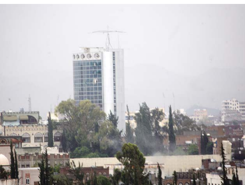
.. أشعلوا الحريق في مكاتب طيران السعيدة

البنين بمختلف الأسلحة وفرض حصار كامل على وكالة (سبأ) والعاملين فيها . واعتبر الصحفيون أن مهاجمة وكالة الأنباء اليمنية (سبأ) التي دمر هجوم أولاد الأحمر وعصاباتهم المسلحة ثلاثة طوابق من مبناها مع شكنيتها التقنية يعد استهدافاً واضحاً وعدواناً أيضاً على جميع الصحفيين باليمن وينم عن حقد دفين على المؤسسات الإعلامية والعاملين فيها الذين يؤدون رسالتهم بكل مصداقية ومهنية ولا علاقة لها بالعمل السياسي. وقال الصحفيون في بيانهم: إن هذا العمل قد تعدى كل القيم الإنسانية والأخلاقية وعكس التوجه الحاقق والعقول الهزمية والهدامة لدى أولاد الأحمر وعصاباتهم الدموية والإجرامية. مطالبين نقابة الصحفيين اليمنيين والجهات السنولة ومنظمات المجتمع المدني بالقيام بواجبها وعدم السكوت على جرائم أولاد الأحمر الذين قادمه جنونهم وحبيهم للسلطة إلى الاعتداء على الصحفيين ومهاجمتهم في مقر أعمالهم .