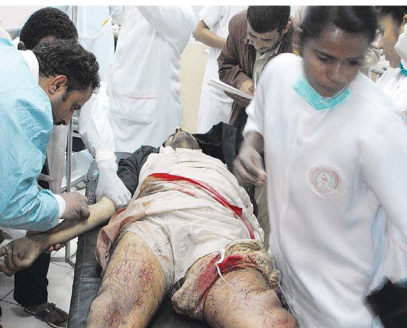
.. ما الذي اقترفه ؟