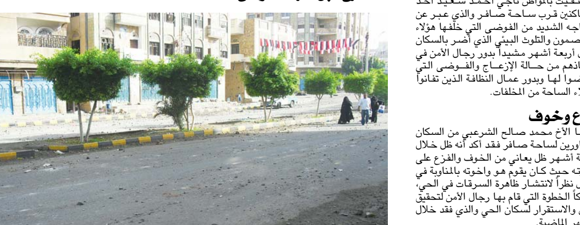
عودة الهدوء إلى المدينة الحاملة..