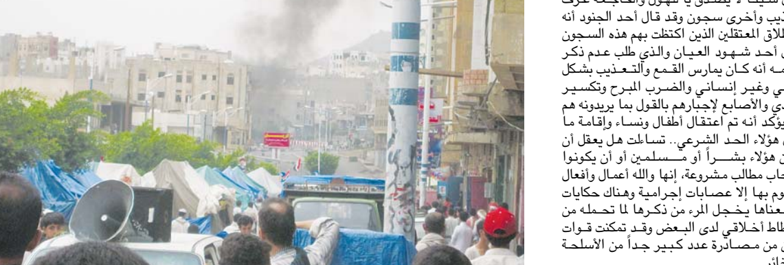
الشارع قبل انتهاء الفوضى..