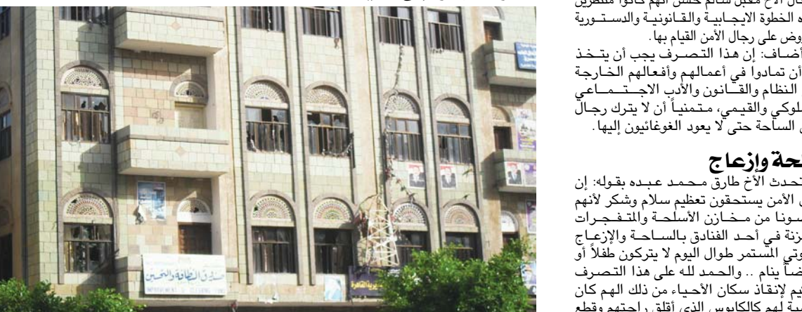
سندوق النظافة وجهود مرجوة لإزالة مخلفات الاعتصام..