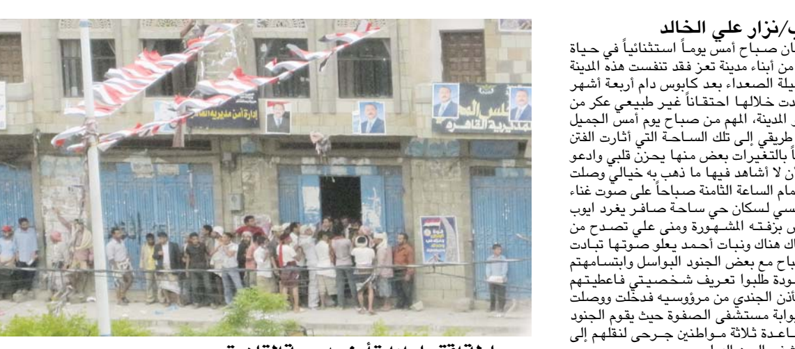
محاولة اقتحام إدارة أمن مديرية القاهرة