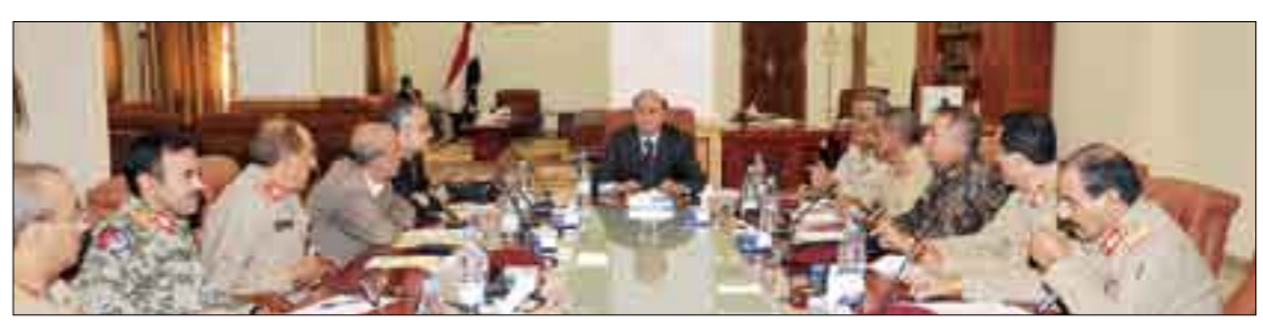
صنعاء / سبأ رأس الأخ عبدربه منصور هادي نائب رئيس الجمهورية أمس اجتماعاً للجنة الأمنية العليا. وفي الاجتماع تم مناقشة المواضيع المتصلة بتثبيت الأمن والاستقرار والسكينة العامة للمجتمع، وإخراج المسلحين من المرافق العامة أينما وجدت، وشدد نائب رئيس الجمهورية على ضرورة استنهاض الهمم وتوحيد الجهود من أجل توفير الخدمات والأساسيات الحياتية مثل البنترول والديزل والغاز والكهرباء، والعمل على التثبيت للصارم لوقف إطلاق النار بصورة شاملة وكاملة.