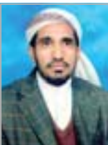
محمد علي دهام

يتسابقون لخدمة رسول الله، ومنهم كبشنة التي لا تريد أن يفوتها خير تقدمه لرسول الله صلى الله عليه وآله وسلم ولهذا الدين العظيم، وكانت أول من بايع رسول الله صلى الله عليه وآله وسلم عند وصوله المدينة، وكان لها مواقف لا ينساها لها التاريخ... منها عندما خرج ولدها سعد بن معاذ وأخوة عمر إلى بدر ففرحت بذلك فرحاً شديداً وتمنت لهما الشهادة في سبيل الله.. وخاصة بعد أن سمعت بما قال ولدها سعد لرسول الله: لكأنك تريدنا يا رسول الله فقد أماناً بك وصدقناك... إلى آخر حكيمته المشورة.