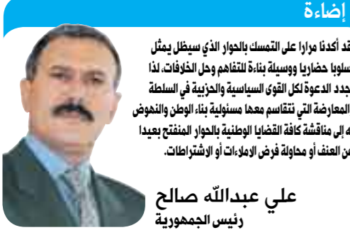
علي عبدالله صالح رئيس الجمهورية