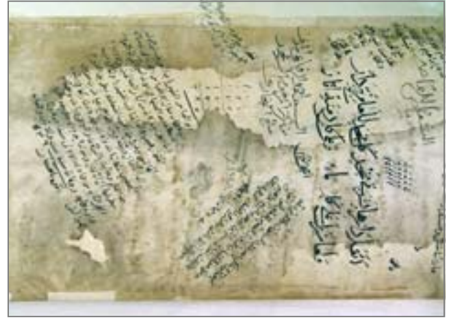
يفتتح بعد غد ويضم ١٧ أجنحة و١٣٥ لوحة لمخطوطات نادرة