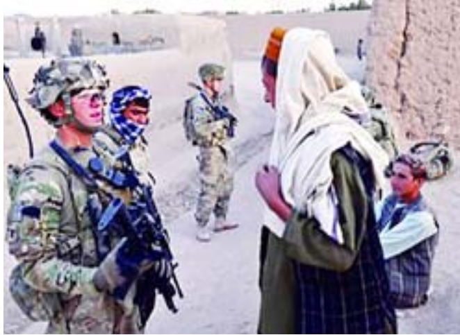
حكومته ويعمل أكثر من طاقته.

يرى محللون وقياديون فلسطينيون أن إسرائيل تستخدم كافة الوسائل السياسية والإعلامية والدبلوماسية لإفشال مساعي الفلسطينيين للتوجه إلى الأمم المتحدة في سبتمبر المقبل للحصول على اعتراف دولتهم على حدود العام ١٩٦٧م. وقال الباحث الفلسطيني أمل جمال إن تسييرات الإعلام لقرار رئيس الحكومة الإسرائيلية بنيامين نتانياهو التفاوض على أساس مقترحات أوباما ما هو إلا مناورة سياسية وإعلامية. وأضاف أن نتانياهو استخدم هذه المناورة للحد من الدعم الدولي الجلي وغير الرسمي للفلسطينيين ولإستيعاب الصدمة مسبقاً ووضع الكرة في ملعب الفلسطينيين كي يتخلى الفلسطينيون عن مشروعهم التوجه إلى الأمم المتحدة في سبتمبر المقبل. إلا أنه رأى أن الحملة الإعلامية والدبلوماسية والسياسية التي يقوم بها نتانياهو وحكومته ضد إعلان الدولة الفلسطينية دولة على ما يبدو. وأشار جمال إلى تناقض كبير بين مواقف نتانياهو والرئيس الأمريكي باراك أوباما وهناك ضغوط أمريكية كبيرة على نتانياهو للتحرك نحو المفاوضات في سبتمبر.