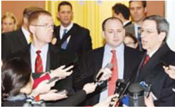
..عواصم/وكالات أعلن دبلوماسيون في الاتحاد الأوروبي أمس، إن البندوك التي تتولى الرئاسة الدولية للاتحاد اقترحت أن يبدأ سريان حظر استيراد النفط الإيراني للول الأعضاء أول يوليو بعد انتهاء فترة سماح محتملة للعودة الحالية. وعارضت روسيا مجدداً فرض حظر دولي على واردات النفط من إيران، مهددة باستخدام حق النقض (فيتو) ضد صدور قرار من مجلس الأمن بهذا الشأن فيما قالت إيران إن وفداً من الوكالة الدولية للطاقة الذرية سيوزر البلد أواخر يناير، وسط تعزيز إجراءات حمايتها للعاملين في المجال النووي لديها، داعية الاتحاد الأوروبي إلى وضع محالته للتطبيق بدلاً من الاستسلام لضغط الولايات المتحدة، كما دعت السعودية إلى التراجع عن قرارها زيادة إنتاجها النفطي.

وقال دبلوماسي من الاتحاد الأوروبي رفض نشر اسمه: «تقدمت الرئاسة الديمقراطية بقرار فرض حظر كامل بداية من أول يوليو، لم يتم التوصل لاتفاق بعد». وأضاف أن البرلمان الذي يعتمد على النفط الإيراني ترحب موافقتها لعين تيسر أداء عملها من خلال النفط الإيراني ويهدف الاقتراح التركي والذي يسعى المل الوسط لتهدئة مخاوف بعض حكومات الاتحاد الأوروبي بشأن التأثير الاقتصادي لحظر النفط الإيراني على اقتصاداتها المنخفضة ويوجب الخطة التي يسيها اقترها جميع عواصم دول الاتحاد تمنع دول الاتحاد مل حتى نهاية يونيو لتطبيق الخطة الحالية على أن تتوقف جميع الواردات في بداية يوليو.