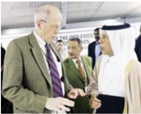
قال المبعوث الأمريكي إلى إقليم دارفور