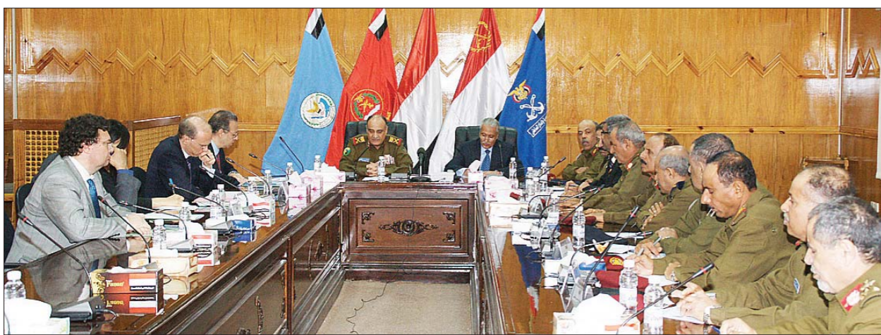
اللجنة العسكرية تناقش سير عملها في إزالة المظاهر المسلحة