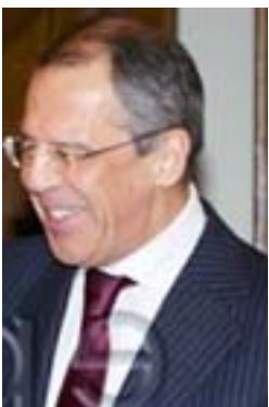
موسكو/وكالات أعلنت موسكو أمس، انها "منفتحة" على أي مقترحات بناءة بشأن سوريا إلا أنها لا تزال متمسكة بمعارضتها لأي خطوة في الأمم المتحدة تزيد العقوبات الاخوية التي جرت الصاقها عليها سابقاً أو استخدام القوة ضد دمشق، في إشارة إلى عدم تغير موقفها من استخدام الحكومة السورية القوة ضد محتجين يسعون لإنهاء حكم الرئيس السوري بشار الأسد. وقال وزير الخارجية الروسي سيرجي لافروف عقب محادثات أجراها مع نظيره التركي أحمد داود أوغلو "نحن مفتشون على أي مقترحات بناءة تتسم مع المهمة المحددة بأنها، العنف". وأضاف لاغروف ان بلاده وتركيا تعارضان الموقف العسكري الدولي في سوريا وترتان ان الحوار هو السبيل الوحيد لإنهاء العنف المستمر منذ ١٠ أشهر.

كما أثار موسكو منذ ذلك الحين غضب الغرب بمواصلة بيع الأسلحة لطيفتها سوريا منذ الحقبة السوفيتية، بل عدلت مؤخراً صفقة جديدة لبيع طائرات مقاتلة صغيرة لنظام الأسد. وانتقدت بريطانيا وفرنسا والولايات المتحدة بشدة روسيا اللية قبل الماضية، على تزويدها سوريا بالأسلحة. وقال السفير البريطاني في الأمم المتحدة ديك ليال جرانت في اجتماع لمجلس الأمن أثناء مناقشة مشكلة الشرق الأوسط، "نحن نشعر بقلق من تزويد أسلحة إلى دمشق سواء كانت