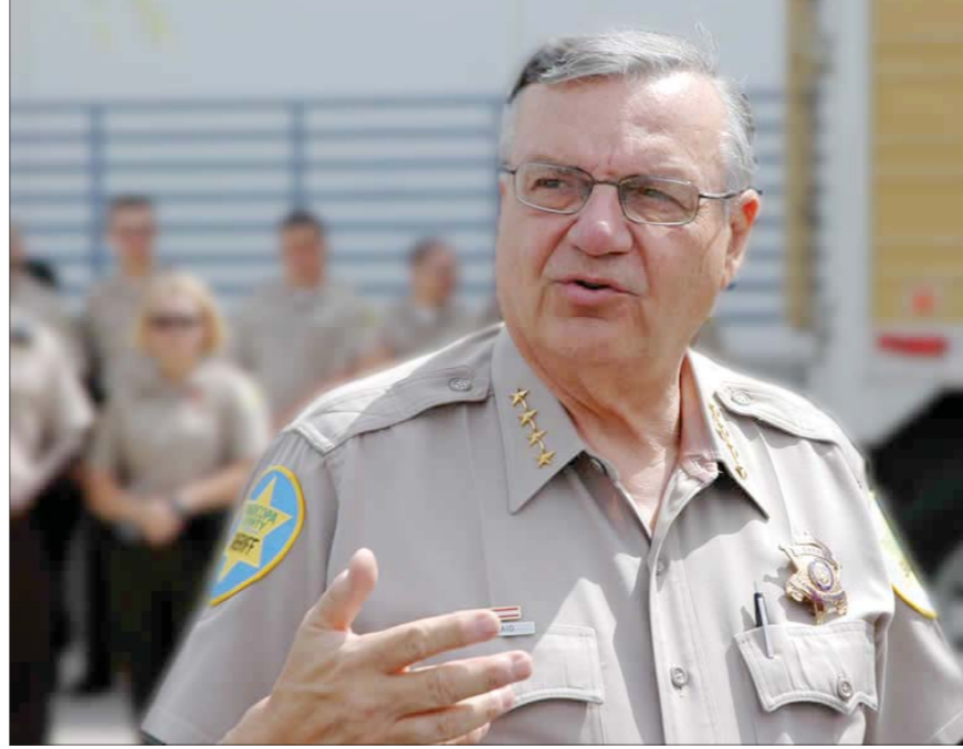
اشدجوزف أرابايو .. محبوب وسائل الإعلام الأمريكية

ألف دولار في أول شهر... وبعد ذلك اجتهدت حتى وصل دخلها الشهري حالياً إلى ١٧ ألف دولار. إيمي قالت في المقابل التي نشرها موقع « نيوز ناو » الاثنين الماضي ( ٧ مايو ) إنها تشكر الله يومياً على هذه الوظيفة التي تقوم بها في المنزل إلى جوار أداء واجبها كام .