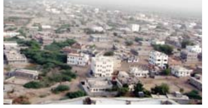
حائراً .. زنجبار خالية من الإرهاب

دعت مواطني المحافظات المجاورة إلى منع الإرهابيين من اللجوء إلى مناطقهم