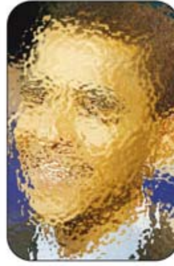
< من صاحب هذه الصورة؟