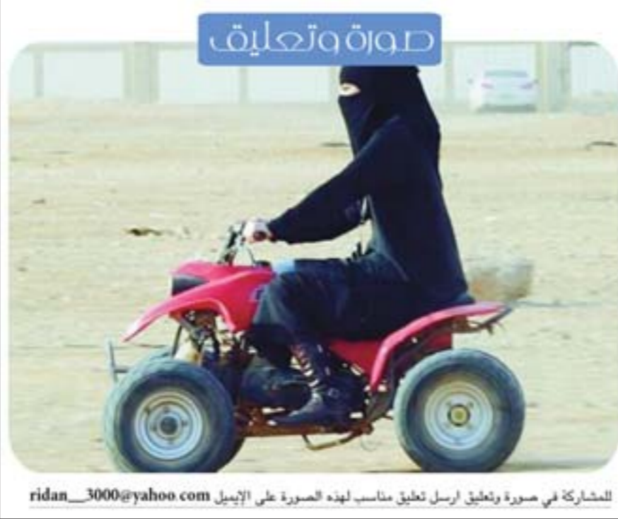
المشاركة في صورة وتعليق ارسل تطبيق مناسب لهذه الصورة على الإيميل ridan_3000@yahoo.com