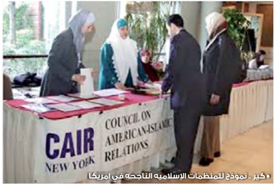
• كير .. نموذج للمنظمات الإسلاميه الناجحه في امريكا

رسالة امريكا : محمد قاسم الجرموزي aljermozi@hotmail.com