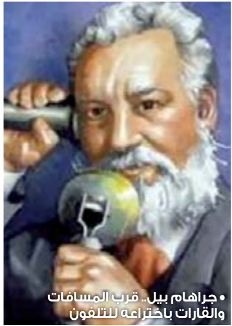
• جراهم بيل... قرب المسامات والفارات باختراعه للتلفون

دائماً – المواطن البسيط ... فالذين قتلوا في التظاهرات ضد الفيلم السيئ قتلوا برصاص اخوانهم في الله والدم والترهبه ...! وهذا ما هدف ويهدف اليه من هم وراء الفيلم ... فهل نستخدم عقولنا قبل ان تخطو اقدامنا (اتمنى ذلك) ...!!!!