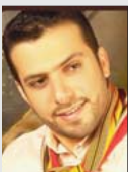
العدد من القارئ: 16 سنة. التخص: كالوريوس (علم) (علاقات عامة). مدير مؤسسة إنتاج إعلامي، الشبيبة بركة الفصل الفنية باني البروك شارك في الفترة في شريط الجرح الكرام عام 1997م.