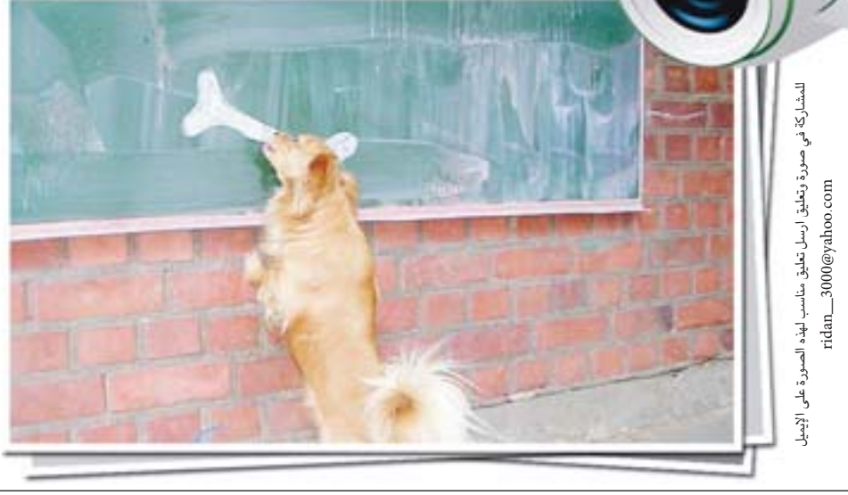
المشاركة في صورة وتعليق أرسلنا ثلاثين مشاركة فائزة الصورة على الإنترنت ridan_3000@yahoo.com