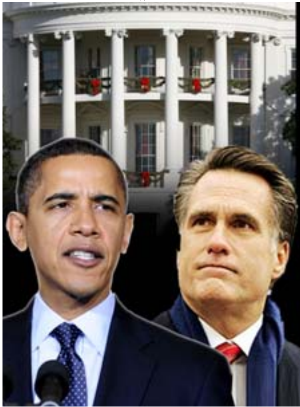
وحاول رومني في الأيام الماضية تبني موضوع التغيير الذي بنى عليه أوباما حملته الانتخابية التي لم يصوتوا له في الانتخابات الأمريكية لكنه حرص على أن يكون رئيسا لهم