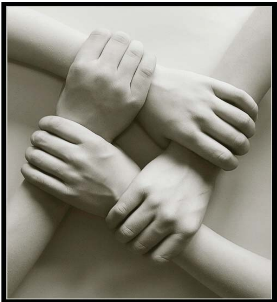
الشيخ/فتحي السيد منيسي

وأوضح وكيل وزارة السياحة- أنهينا عملية توثيق العقود لعملية سكن الحجاج وتم الحصول على أحسن الأماكن حول الحرم المكي والمدينة وسيتم تقديم كافة الخدمات