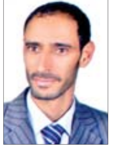
نجيب محمد الزبيدي

● خمسون عاما منذ قيام الثورة السبتمبرية، تسعة وأربعون عاما على قيام الثورة الأكتوبرية لا بأس وأن تحتفل للشعب أن يفرح ويسعد، ذلك حق له والكلي يجمع على ذلك فالأمر مفروغ منه إذا الأعياد في تواصل ومسلسل الأفراس لا زال مستمرا بالأسس جاءنا سبتمبر في ثوبه الأنيق «اليوبيل الذهبي ٥٠ عاما» وما هو اليوم قد أقبل وأتانا عيد آخر النور يتلألأ من بين جوانبه ملا كل البقاع والشعاب وأقتد بنوره عاليا وقد أضاء قمم تلك الجبال هذا أكتوبر العطاء هنا التاريخ يبعث من جديد أخبارهم يا قم ردفان الأبية يا جبال شمسنا الشامخة هنا يصنع الأبطال هذه الأم الحاضنة المدرسة منها وفيها تخرج الرجال الأشاوس الكليل لبي النداء ما تراجع أحد منهم إلى الوراء ومتى كان للبيوت الأسود الكاسرة أن تفر وتقهقر ذلك من المستحيل تصديقه.