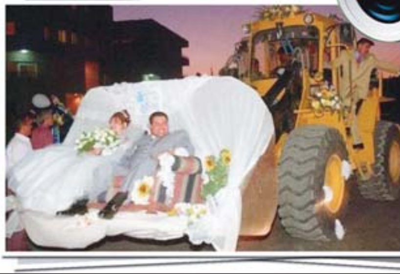
المشاركة في صورة وتعليق أرسل تعليق مناسب لهذه الصورة على البريد الإلكتروني: ridan_3000@yahoo.com - 7732320088