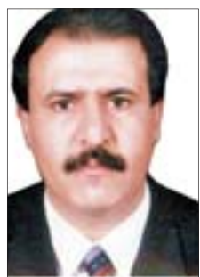
عبد الملك السلال

الإيرانية... أبيض وأسود أو ملون، المهم لحية والسلام، ضبجنا من حليقي اللحاء هؤلاء.