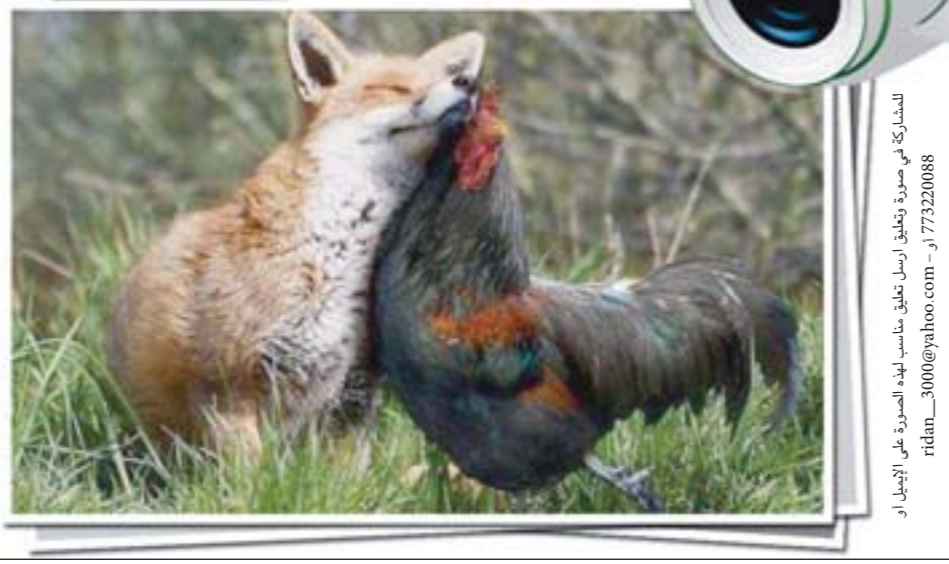
المشاركة في صورة وتعليق أرسل تعليق مناسب لهذه الصورة على البريد الإلكتروني: ridan_3000@yahoo.com - 773220088