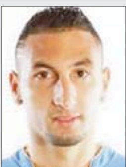
فهد بلحاج هو لاعب كرة قدم جزائري ولد في جوان / حزيران / يونيو 1987 في سان كلود (جورا) بفرنسا.