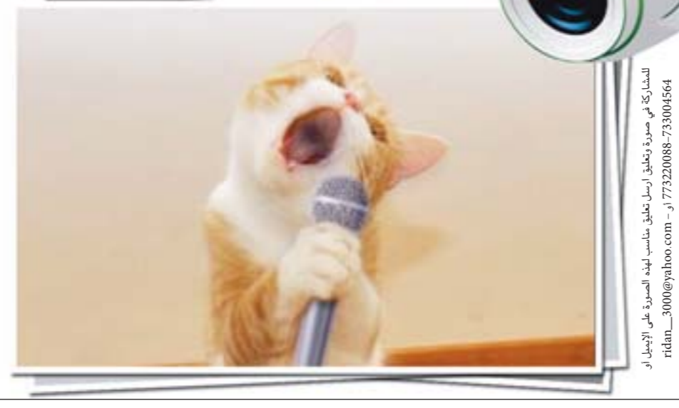
المشاركة في صورة وتعليق أرسل تعليق مناسب لهذه الصورة على الإيبل أو ridan_3000@yahoo.com - 7732320088-733004564