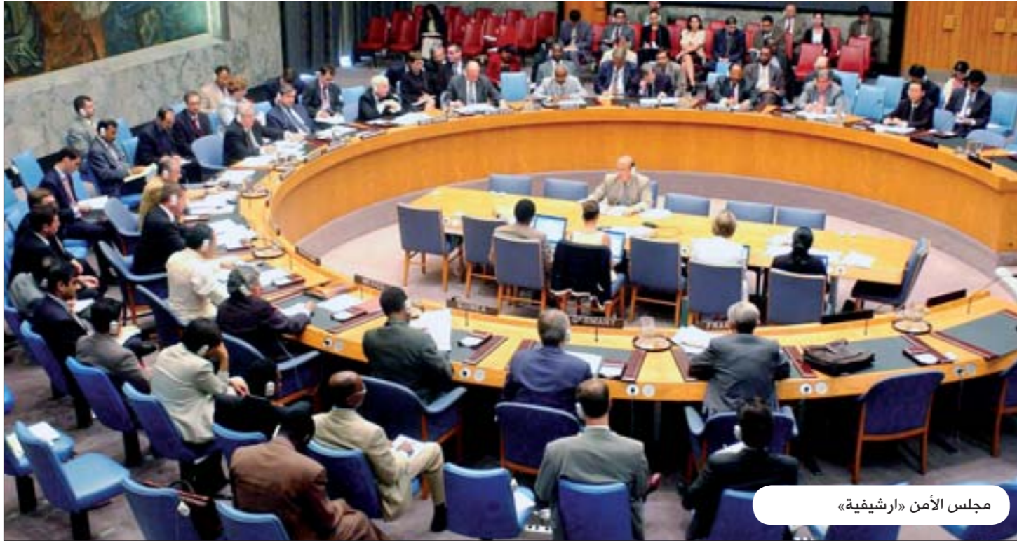
مجلس الأمن «إرشيفية»

التي لاتزال تعترض البدء بتنفيذ المرحلة الثانية من المبادرة الخليجية والبتها التنفيذية، كما سيطلع مجلس الأمن على نتائج زيارة رئيس المجلس الدوري مندوب بريطانيا الدائم مارك برانت بمعية ممثل المجموعة العربية مندوب المغرب الدائم محمد لوليشكي إلى اليمن الأحد الماضي ولقاءهما مع رئيس الجمهورية والحكومة ولجنة الشؤون العسكرية وفنية الحوار الوطني..