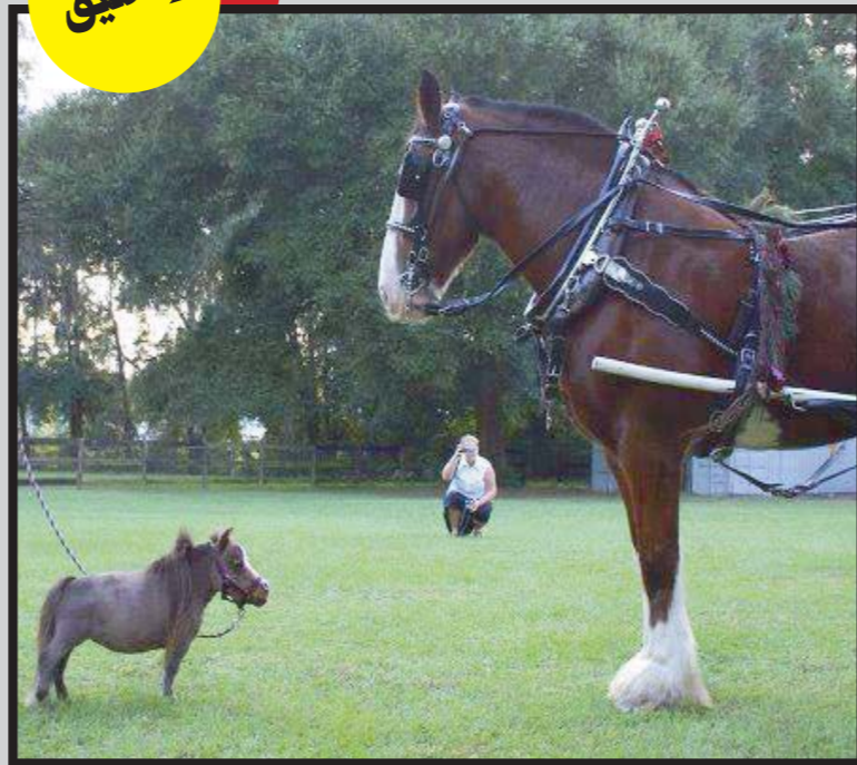
للمشاركة في صورة وتعليق ارسلي تعليق مناسب لهذه الصورة على الإيميل ridan_3000@yahoo.com أو 773220088-733004564 أو