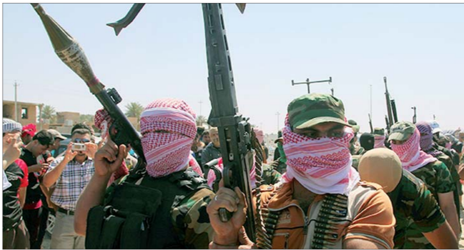
جيش من العشائر لحماية ساحات الاعتصام

يحموم شبح الحرب الأهلية في أجواء العراق على خلفية تصاعد أعمال العنف الطائفية والفساد السياسي، الأمر الذي جعل لغة الرصاص هي السائدة قد يعيد بلاد الرافدين إلى مرحلة الصفرة وهو يواجه موجة عنف دام عقب أحداث اقتحام قوات الجيش لساحة الاعتصام في قضاء الحويجة جنوب غرب كركوك، والتي أسفرت عن مقتل وإصابة العشرات من قوات الأمن والمعتصمين.