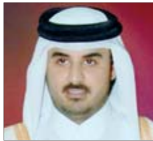
سمو الشيخ نعيم بن حمد آل ثاني