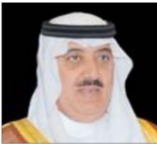
الأمير متعب بن عبدالله بن عبدالعزيز