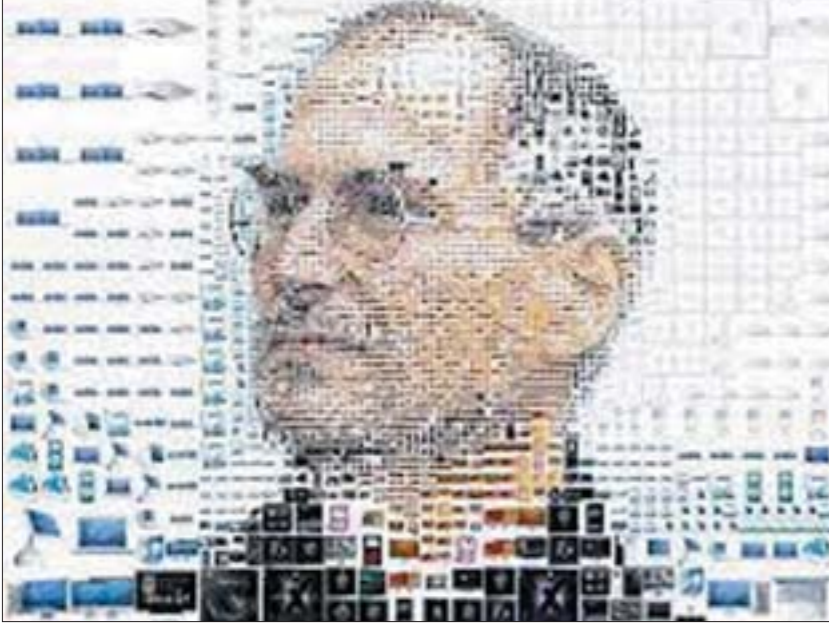
■ ستيف جابز بريء من تهمة البخل...؟!..

انه بخيل ولم (يفعل خير)... إلا أنه لم يرد عليها ولم يذكر في أحاديثه الصحافية أو في مذكراته أنه تبرع بأموال للأعمال الخيرية... الإثنان الماضي ذكرت أرملته لورين في مقابلة مع صحيفة النيويورك تايمز أنها وزوجها استقصدا عدم ذكر وتضخيم التبرعات التي قدموها إلى الأعمال الخيرية لأن ذلك يقلل من قيمتها... وفي هذا قال تيم كوك رئيس مجلس إدارة آبل إن ستيف جابز تبرع من ماله الخاص بـ 50 مليون دولار لمستشفيات ستانفورد.