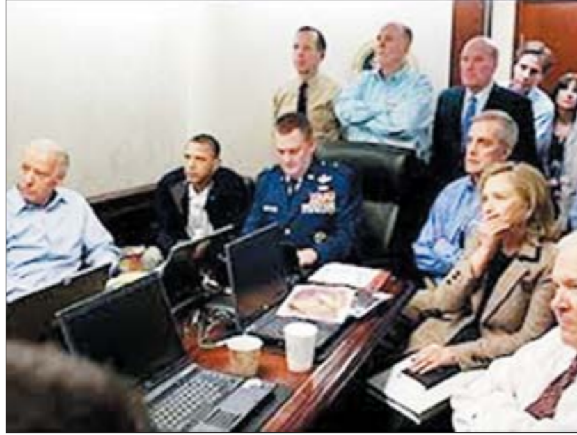
■ كبار الإدارة الأمريكية في البيت الأبيض يتابعون مباشرة لحظات استهداف بن لادن.

رغم أن الكثير من وسائل الإعلام انتقدت ستيف جابز مؤسس شركة آبل ورئيس مجلس إدارتها السابق قبل مماته وقالت