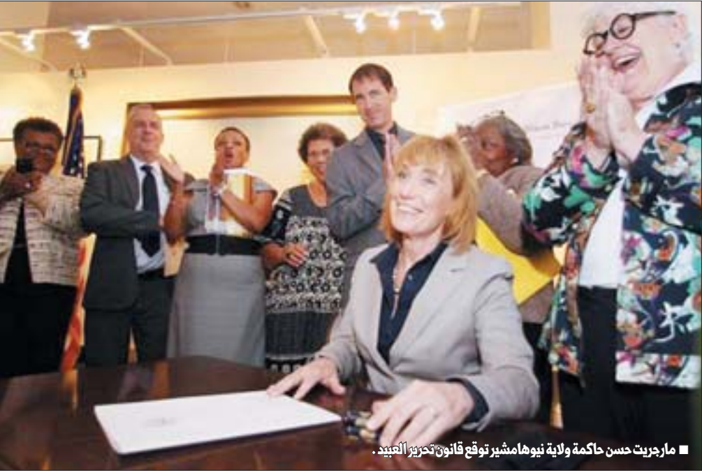
■ مارجريت حسن حاكمة ولاية نيوهامشير توقع قانون تحرير العبيد.

بعيداً عن فضائح البيت الأبيض والتي كان آخرها فضيحة التنصت ومراقبة التلغونات والمواقع الالكترونية... نركز اليوم على القانون الفريد الذي وقعته مؤخرًا مارجريت حسن حاكمة ولاية نيوهامشير... تفاصيل عن ذلك وعن ثلاثة مواضع حفيضة وممتعة في ثانيا السطور التالية :