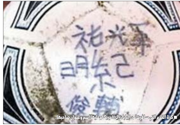
■ كرة القدم التي سافرت مع اليابانيين إلى أميركا وعليها اسم وعنوان صاحبها.