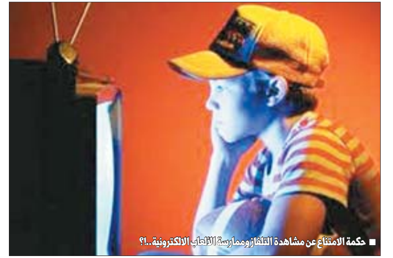
■ حكمة الامتناع عن مشاهدة التلفاز وممارسة الألعاب الالكترونية...!

أو ممارسة الألعاب الالكترونية يصل إلى سبع ساعات يومياً. ومع ذلك هناك من عارض هذه الفكرة وقال إن هناك برامج تلفزيونية تربوية وثقافية مفيدة وغير ضارة ولا يجب الابتعاد عنها... لأن هناك ألعاباً تنمي قدرات الطفل وتساعد على التحصيل العلمي والتفكير الناضج... ومع هذا كله يبقى الدور الكبير على العائلة في عملية تقنين الوقت واختيار وتوجيه الأطفال لمشاهدة المفيد والأفضل... واستغلال نعمة التكنولوجيا فيما يفيد الفرد والمجتمع حتى يكون للحياة طعم لذيذ ومذاق خاص.