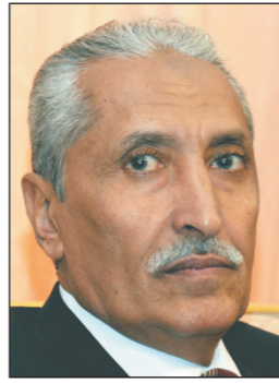
الدعم الذي تقدمه فرنسا للأجهزة الأمنية اليمنية.

كما ناقش اللقاء علاقات التعاون بين البلدين في مجال تقنية الجوازات الالكترونية الحديثة. وأستمع وزير الداخلية من مندوب الشركة الفرنسية إلى شرح حول مواصفات وتقنية الجوازات الإلكترونية الحديثة التي تعمل بالترخة الذكية غير القابلة للتزوير. من جانبه أكد السفير الفرنسي بصنعاء موصلة دعم حكومة بلاده للمين في المجال الأمني لما من شأنه تحقيق المزيد من الأمن والاستقرار.