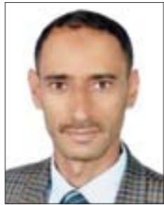
نجيب محمد الزبيدي

< فعلى أعضاء مؤتمر الحوار الوطني تحمل المسؤولية التي يتطلع إليها أبناء الوطن من أجل تحقيق آمالهم وتطلعاتهم، وهي مخراجات نظام حكم جديد ودستور جديد ينقل اليمن إلى مرحلة حضارية حاسمة.. نتمنى للجميع التوفيق والسداد لما فيه خدمة الوطن.