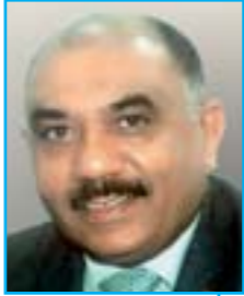
يكتبها / حسن اللوزي

ولكن من ذا الذي باستطاعته أن يقيس ما فعله فينا الشهر الفضيل وما آثار ذلك علينا وكيف عاشت امتنا أداء فريضة الصوم؟؟ وما الذي فعلناه نحن بالشهر الفضيل وبفريضة الصوم ؟ والقيام بكافة الواجبات التعبدية والطاعات المتصلة بحياة التقوى والمسؤوليات المناطة بنا في هذا العمل والإنتاج والبذل والعطاء؟؟ ما الذي فعلناه كشعوب مؤمنة.. وأمة إسلامية جوهرها الالتزام بقيم الإسلام ومكارم الأخلاق وبصورة مثلى وخاصة في شهر هو في حقيقته المفروضة مدرسة تعبدية لتكريس قيم الإيمان بل وبذل أقصى الجهود في أداء كل الفرائض المتلاقية في هذا الزمن القصير في بوتقة أداء فريضة الصوم وإقامة الصلاة وأداء الزكاة والوفاء بالصدقات إلى جانب القيام بأداء المسؤوليات المناطة بكل فرد منا.. ويكل مجتمع إسلامي وبالنظرة الأعم للأمة الإسلامية كافة في كل ميادين العمل والعطاء والبذل والإنتاج.. وهل عكست المظاهر اليومية والحياة المعيشية الصورة الإيجابية الإيمانية التي يصوغها الصوم ؟ وعلاقة العبودية المذمومة والخاشعة لله سبحانه وتعالى والمتفاعلة بروح الإخاء والمحبة والتراحم والتكافل