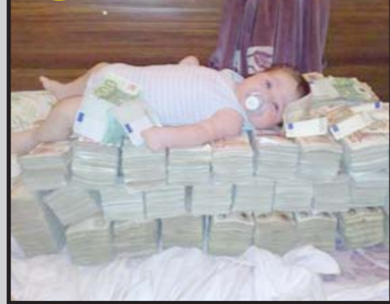
للمشاركة في صورة وتعليق ارسل تعليق مناسب لهذه الصورة على الإيميل أو 773220088-733004564 أو ridan_3000@yahoo.com