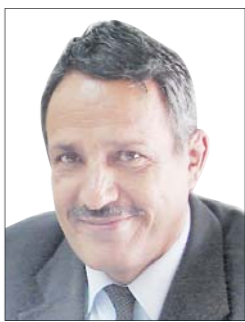
محمد الغري عمران

• الشخصية القلقة (أنور) هي الشخصية المحورية لرواية "الغول الذي ابتلع نفسه" الصادرة عام 2013م للروائية المغربية الزهرة الرميح عن دار النايا بدمشق. شاب يحمل بأن يكتب الرواية المكملة.. وهمة البحث عن فكرة عظيمة.. مهيبا لنفسه أسباب يلظن بأنها ستساعده على اقتناص تلك الفكرة.. وقد خصص شقة بأحد العمارات بأطراف المدينة لكي يتزوي بعيداً عن أي علاقة.. بما في ذلك حبيبته سلمي.