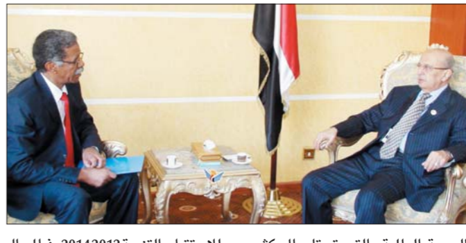
للاستقرار والتنمية 2012-2014 في المجال الصحي. والدعم والمساندة، مؤكداً أن المنظمة ستواصل دعم الحكومة والأنشطة والأولويات التي تضمنها البرنامج مرحلياً