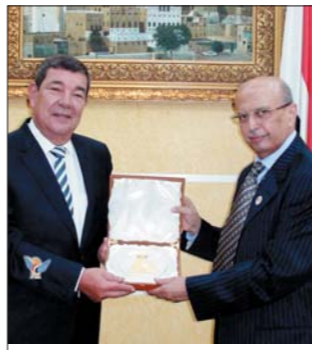
كوبا اوسكار دي لوس ريبس راموس بمناسبة انتهاء فترة عمله كسفير مقيم في صنعاء.

من جانبه أشار السفير الكوبي إلى عمق العلاقات الثنائية بين البلدين والشعبين الصديقين، معبرا عن شكره وتقديره للحكومة اليمنية على التسهيلات التي قدمت له أثناء فترة عمله. حضر اللقاء نائب رئيس دائرة المراسم بوزارة الخارجية يحيى محمد الشرفي.