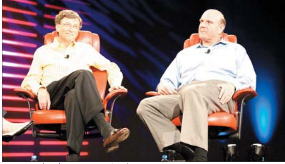
• ستيف بولمير (يمين) ودع شركة بيل قيتس (يسار) بالدموع والغناء.