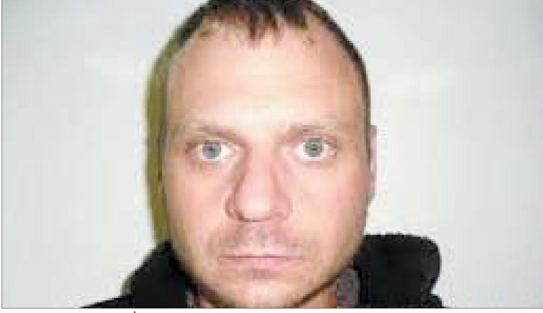
• رسالة تلفونية بالخطأ أوقعت نيكولاس ديبلير في يد الشرطة.