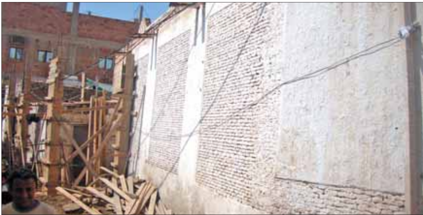
• مخالفة ملاصقة لاحد المساجد (جديدة)

بداية يقول الأخ عبد السلام الضلعي وكيل وزارة الإدارة المحلية وعضو اللجنة العليا للحفظ على زبيد مندوب وزارة الإدارة المحلية: كان نزولنا إلى زبيد بطلب من هيئة الحفاظ على المدن التاريخية ويتكليف من الجهات التي جئنا لتفعيلها وبعد لقاءتنا التي أجرينها مع الأخ المحافظ وتمت المكاشفة المناقشة تم التوصل إلى تنفيذ النقاط الثلاث وبصورة سريعة كخطوة أولية لإثبات النوايا الجادة لليونسكو والتي تطالب اليمن حالياً بتقرير مفضل عن حال المدينة والخطوات والانتجازات التي نفذت على صعيد الحفاظ، وإذا ما تم توقيف المخالفات خاصة الاعتداء على الشوارع والمساحات للمدن العالمية في قطر، وحقيقة وجدنا تفاهة من قبل الأخ المحافظ واستعدادا لتحمل المسؤولية في هذه المرحلة ونأمل منه خطوة عملية والكرة الآن في ملعب الأخ المحافظ بالعمل على تنفيذ النقاط التي تم الاتفاق عليها، أما في اجتماعنا مع رئيس المجلس المحلي بزبيد وأمينة العام والشخصيات الاجتماعية لاحظنا أن مدير الأمن لم يدع للاجتماع وكان من الغرض أن يدعى لكي يتم مواجته بالدعاوي والشكاوى التي طرحته ضد الأوراق التي تشير إلى تقصير والتي توجد منها نسخ لدينا في وزارة الإدارة المحلية وجهات أخرى ونريد أن نعرف وجهة نظره في ما يقال ضدّه ومعرفة لماذا هذا التقصير من قبل