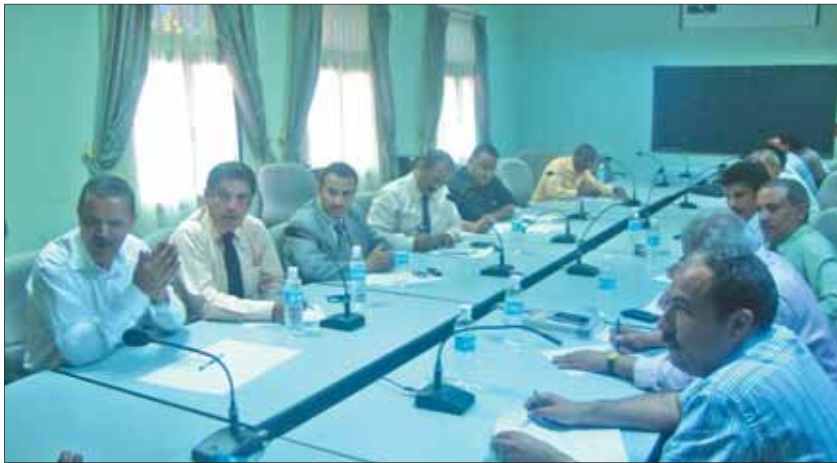
• اجتماع اللجنة مع المحافظ

للحفاظ على زبيد وهو من أبناء زبيد كان يبدو عليه الانزعاج والحزن أثناء جولتنا في المدينة لاسيما عند مشاهدتنا للمخالفات الجديدة التي بدأ العمل فيها. يقول الدكتور المعمري حول الزيارة ونتائجها: الوضع سيء وليست متفائلاً لا توجد مصداقية أو جدية سواء رسمية أو شعبية وهذا نابع من عدم إدراك الجهات الرسمية الحكومة والجهات الشعبية المواطن للقيمة الاقتصادية للتراث. لو تم إدراك هذه القيمة الاقتصادية لأي مدينة تاريخية أو معلم أثري لكنا في خير كبير ولكن السلطة المحلية قل والحكومة كلها.. هل سيتم إيقاف هذه النظر على يعينك هذا المسجد الصغير التاريخي ماذا فعلوا به وكيف تم تشويهه بالاستحداث المزعج الذي لا يليق.. انظر إلى يسارك انظر إلى كل شيء حولك مخالفات وطمس للهوية والقيمة التاريخية لهذه المدينة في الوقت الذي أتكلّم فيه معكم هناك مخالفات تتم ومعنا الآن المحافظ من أبناء زبيد وهو يمثل واجهة معينة وهناك أجهزة أخرى يمكن أن تكون مختلفة معه.