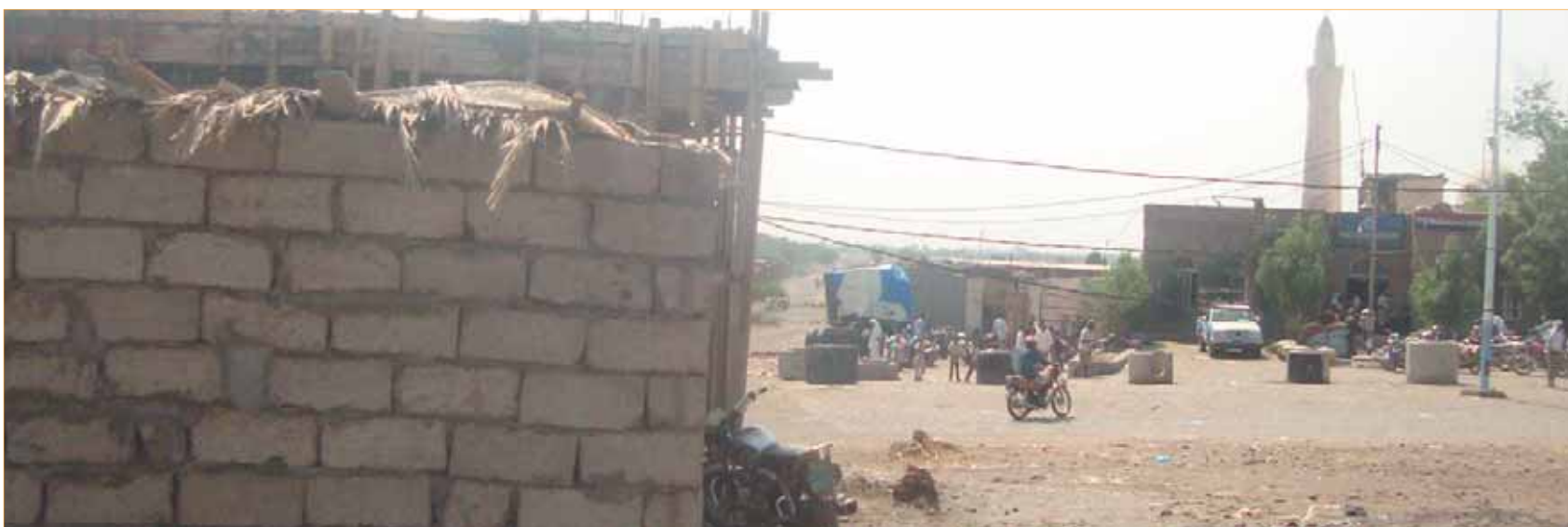
• مخالفة جسيمة أمام إدارة الأمن

الاتفاق مع المحافظ على نقاط ثلاث: توقيف المخالفات وضمان التنسيق مع الجهات المعنية وتفعيل منتدى زبيد