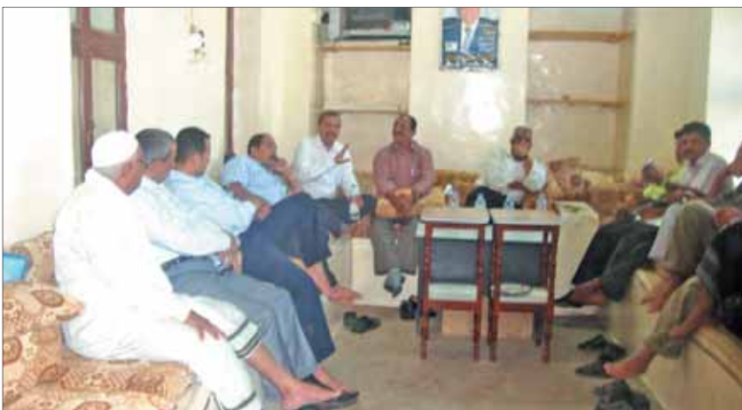
• أثناء الاجتماع بالمجلس المحلي وشخصيات اجتماعية في زبيد

ثوابة: نسعى إلى الحد من المخالفات كخطوة أولى لإثبات جدیتنا وتفاعلنا مع قرارات اليونسكو ولكن أمن زبيد غير متعاون