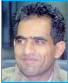
يكتبها / جمال حسن

لا يتطور الصراع، ما لم يكن هناك قيم جديدة تفرض نفسها بقوة. والمهزلة أن الحوثي بدأت قوته تتنامى بصورة متعاطفة وبشكل لم يكن أحد يتوقعه. لماذا كل ذلك يحدث. الم يكن نتيجة تخلف رجال الدولة خلال العقود الماضية. تكريس الفوضى كشكل من ضرورات بقائهم. كانوا كذلك يعلنون وفاة حضورهم في الدولة، حتى وإن هم اليوم يتشبثون باستماتة وبياس لإبقاء رصيدهم وسكة مصالحهم. فاليوم يريد رجال النظام السابق أن يشكلوا قوة ضغط في وقت ترتسم معركة في الشمال، لكن ألا تحضر لدينا مخاوف لسيناريوهات قادمة. لقد أثبتت الحشود الاديكالية ذات البعد الطائفي فشلها في تقليص مشروع طائفي آخر، بل تساهم في تقويته، وإذا أردنا فعلاً مواجهة هذا التبول لميليشيات راديكالية وطائفية، فأمامنا حل وحيد وهو خطاب وطني أولاً، أن نجعل اليمن فوق كل شيء. هل هذا سيكون واقعاً كذلك، حتى وإن كانت هناك مؤامرات في الداخل ومن الخارج. يمكن أن نخرج معه إلى ملامح وطن حقيقية. بدلاً من تلك المشاريع التي تكنس الوطن في طوافات طوائف وعصبويات لا تنتهي.