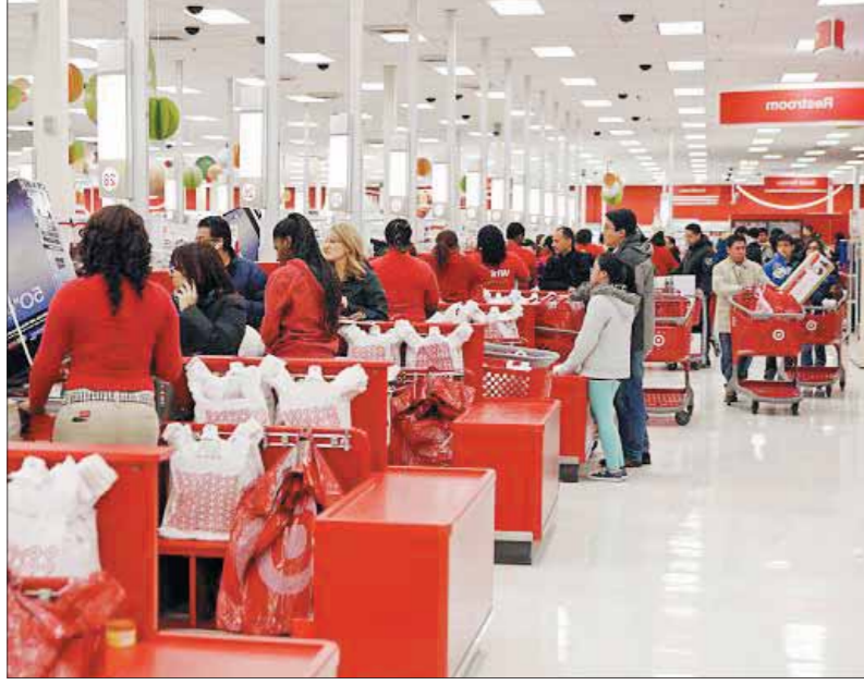
• معظم الزبائن اللذين تسوقوا خلال شهر ديسمبر في محلات تارقت تم السطو على معلومات بطاقاتهم الائتمانية.