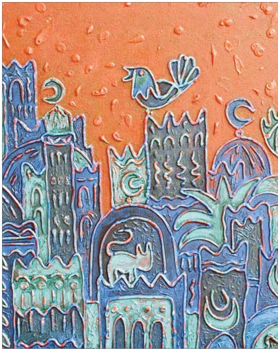
• بريشة / أمينة النصيري

-بينهما- يتناسل حزني ويورق في عتمة تتجمد فيها شرايين روحي على شجر الصمت يحترق الوقت تشتوي الكلمات على ناره الباردة. ••• وفي آخر الليل حين تنام البيوت ويصحو الفراغ يراودني الشوق للناس أشعر أني وحيدٌ وحيدٌ وأن الوجود استوى مسرحاً للوطاويط تعبت في كل زاوية وتطارد في قسوة كل أمنية شاردة.