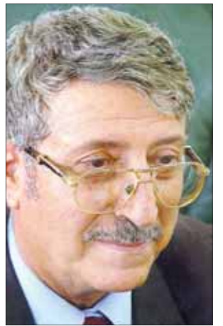
• عبدالعزيز المقالح

كنت في سالف الوقت أهوى الشتاء وأعشق فيه ضبابية اللون سحر الغيوم التي تتمدد فوق الجبال على مهل في زمان الطفولة كنت إذا جاء كانون أزرع في السطح ثلجاً من الماء، ثم ألونه وأحط عليه زهوراً وأحملة في الغداة إلى المدرسة. ••• لم يعد للشتاء الجمال الذي كان، بل صار ذئباً يعض الأصابع والقدمين ويسري إلى القلب أيامه كالحات لياليه عابسة