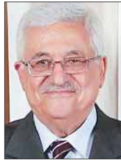
"أن مصر مكلفة بمتابعة المصالحة وان حركة (حماس) جزء من الشعب الفلسطيني ويجب

رام الله/وكالات قال الرئيس الفلسطيني محمود عباس أمس انه لا يوجد حديث عن تمديد مدة المفاوضات مع إسرائيل التي تبقى منها ستة شهور . وأضاف عباس في مؤتمر صحفي عقده مع الرئيس الروماني تروبان باسيسكو اثر لقائهما في رام الله : "إن التركيز الآن على المدة المتبقية من الوقت علما بأنه لم تبحث معنا مسألة التمديد".