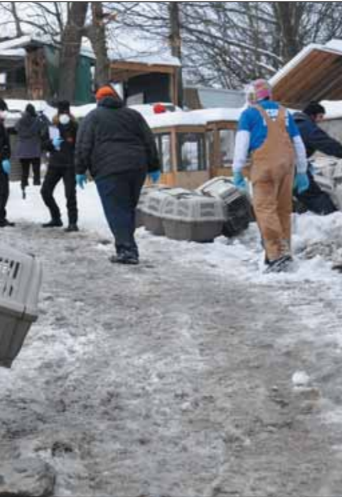
● أثناء مدهامة شرطة نيويورك لساحة مصارعة الديوك واعتقال المظنمين للفعالية.

المخدرات وشرب الكحوليات داخل الساحة... وأمام هذه الجريمة والكم الهائل لم تستطع شرطة نيويورك القبض على الجناة بمفردها ولهذا