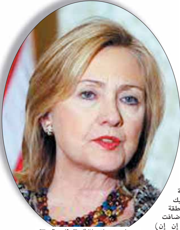
● هيلاري.. تسعى لتتربع داخل قلوب الأميركيين... ولكن...؟!!!

والسجن والغرامة وهذا ما حصل مؤخراً (8 فبراير) في مدينة نيويورك عندما تم تنظيم مصارعة بين 3 آلاف ديك ودجاجة في منطقة كوينز... وأضافت شبكة (سي إن إن) التلفزيونية أن هذه المصارعة الأكبر في تاريخ المدينة وأن الدخول برسوم وأنه تم السماح بتعاطي