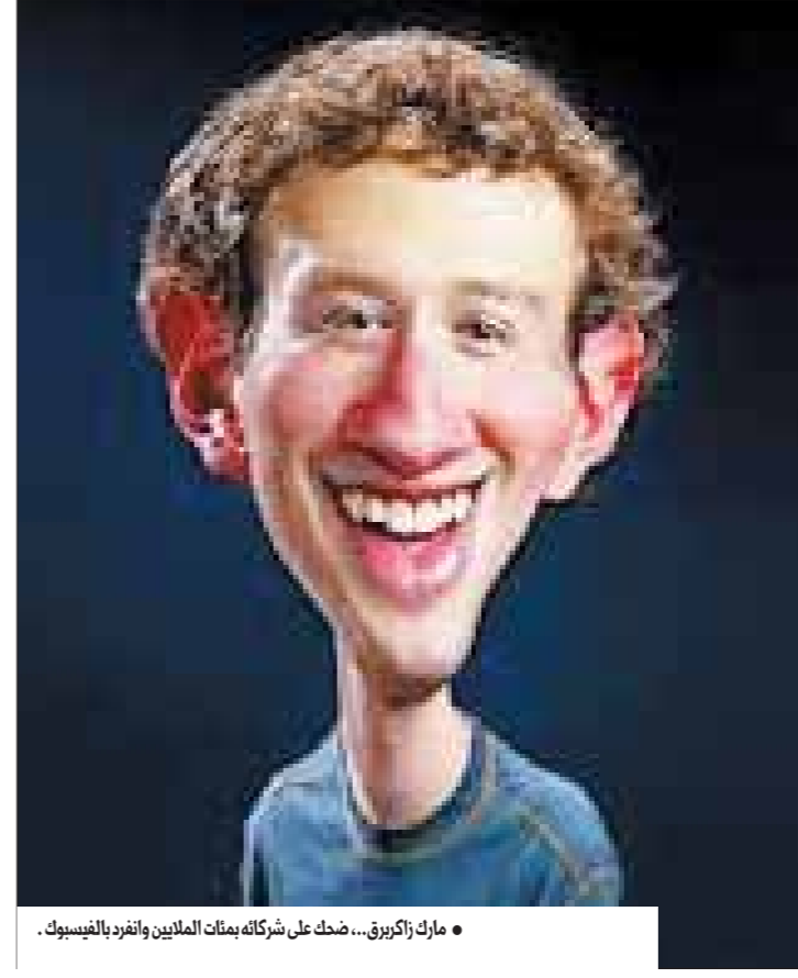
● مارك زاكريق... ضحك على شركائه بمئات الملايين وانفرد بالفيسبوك.

وإذا استطاعت هيلاري أن تقفز من فوق هاتين الحجرتين أو تحطيمهما ستصبح الفرصة أمامها أفضل. هذا الكتاب الذي ألفه الكاتبان جانثين ألين وإيمي برانز يركز على إعادة نهضة هيلاري السياسية حسبما رواها شهود عيان كانوا قريبين من حياتها السياسية