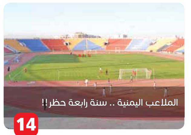
الملاعب اليمنية .. سنة رابعة حذر!!