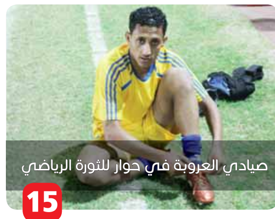
صيادي العروبة في حوار للتورة الرياضي