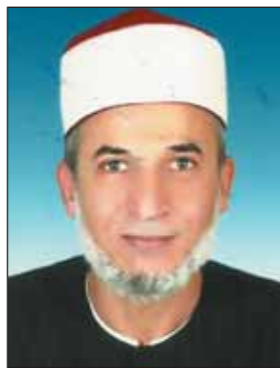
الشيخ الدكتور / محمد محمد أحمد عويس

هؤلاء لحال كبار السن المرأة العجوز والشيخ الكبير عندما تتعثر أقدامهم في الظلام، أما تألم هؤلاء عندما تتحول مدن بأكملها لظلام دامس يقع فيها من حوادث السير ما لا يعلمه إلا الله . أنسى هؤلاء أنهم بذلك أهدقوا عباد الله الفقراء ماديا ومن هنا وفي ضوء ما سبق كله فإن التفجيرات للمنشآت العامة والخاصة حرام أيا كان سبب ذلك ولا تقبل بحال من الأحوال، قال تعالى [ ولا تفسدوا في الأرض بعد إصلاحها ] سورة الأعراف، وقال تعالى [ ولا تبغ الفساد في الأرض ] سورة البقرة، وقال صلى الله عليه وسلم " لا ضرر ولا ضرار " ومن الكليات الخمس أو الضرورات الخمس التي انتقلت جميع الشرائع على حفظها وحمايتها: 1- حفظ الدين. 2- حفظ النفس. 3- حفظ النسل. 4- حفظ العقل. 5- حفظ المال. فضلا عن أن هذه التفجيرات فيها استهانة بحرمة الدماء، واستهانة بحرمة الأموال، واستهانة بحرمة الأمن، وفيها ترويع الأمن وإيذاء للخلق، فمن يتحمل ذلك أسام الله، ثم بعد ذلك ألا يتذكر هؤلاء الذين يخربون المنشآت بتفجيرها، ألا يسمعون لوصية رسول الله صلى الله عليه وسلم في حديث "بريدة" رضي الله عنه. كان رسول الله صلى الله عليه وسلم إذا أمر أميرا على جيش أو سرية، أو أوصاه في خاصته بتقوى الله ومن معه من المسلمين خيرا، ثم قال: اغزوا باسم الله ولا تقبلوا ولا تغفلوا، ولا تقتلوا وليدا. وروى الإمام أحمد في مسنده من حديث ثوبان مولى رسول الله صلى الله عليه وسلم أنه سمع رسول الله صلى الله عليه وسلم يقول (من قتل صغيرا أو كبيرا أو أحرق نخلا أو قطع شجرة مثمرة لم يرجع بكافا) رواه أحمد، وفيه راو لم يسم، وابن لهيعة قيد ضعف.