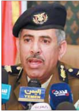
السفير التركي تشورمان

وأوضح أن قيادة الوزارة تسعى لتطوير وتحديث العمل الأمني والشري المهني، وقامت بإعداد مصفوفة لهذه المناصب لمن يريد أن يتقدم لشغلها من خلال ما سبقه من رؤى وبرامج وخطط وأهداف تتطور من عمل الإدارات حتى يرتقي بأدائها، داعياً الجميع إلى التحلي بروح المسؤولية والارتقاء بتطوير منظومة العمل الأمني والشري. من جانب آخر أكد وزير الداخلية اللواء عبده حسين الترب أن اليمن يعمل على تفعيل برتوكول التعاون الأمني مع تركيا خصوصاً في مجالات التدريب والتأهيل النوعي الشري وتبادل الخبرات الأمنية مشيراً خلال لقائه أمس السفير التركي بصنعاء فضل تشورمان ونائب رئيس شركة هوا إلسان التركية