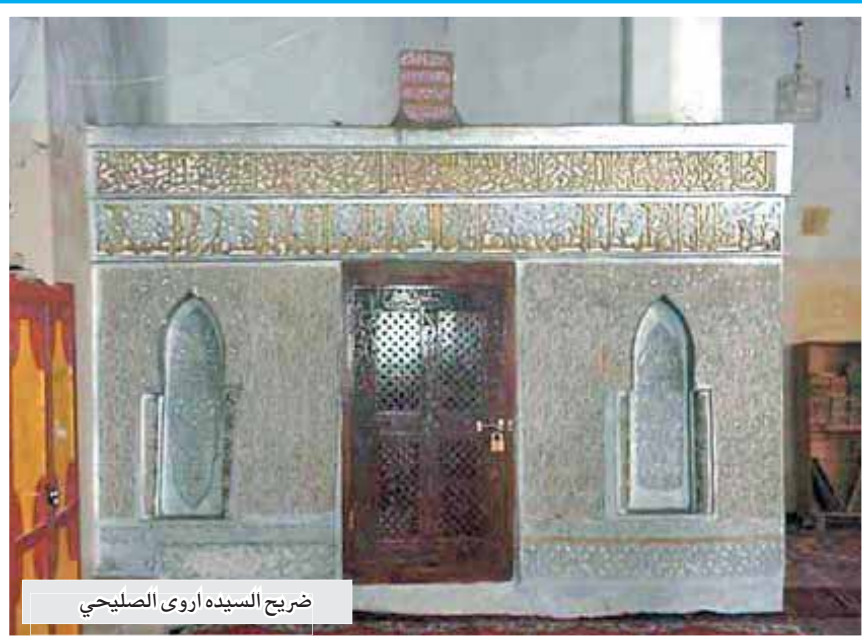
ضريح السيدة اروى الصليحي