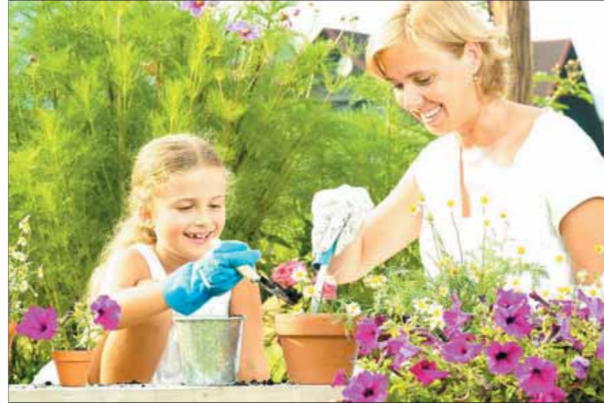
• الاستعداد لفصل الربيع سلوك يتجدد كل عام بتجدد زهوره