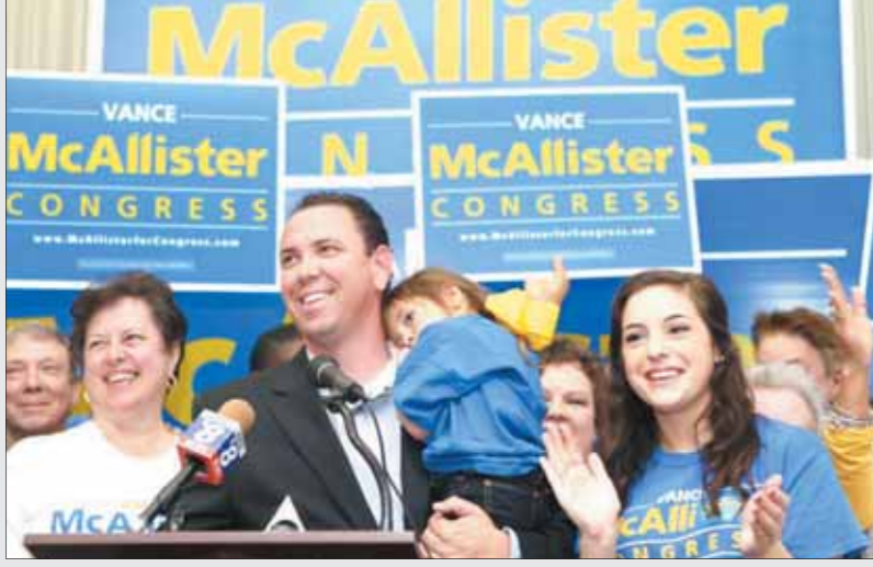
• البرلمانى فانس ماك أليستر مع عائلته أثناء حملته الانتخابية

غلطة واحدة أو كذبة قد تطيح بأكثر مسؤول في أمريكا... والسبب قوة صوت المواطن والمدعوم بقوة القانون... وفيما يلي أحدث مثال على ذلك: