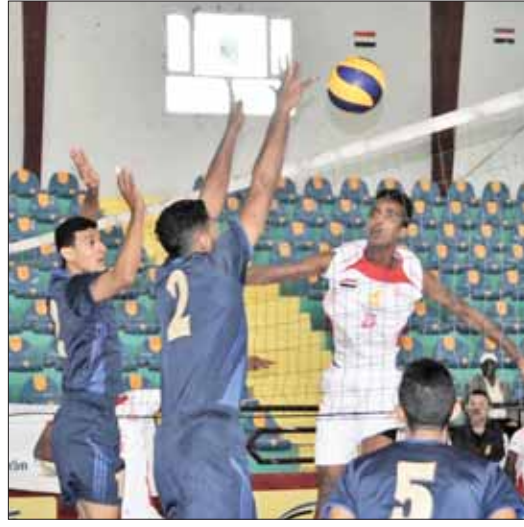
شعب حزموت يكسب حسان في دوري الطائرة

فوز شعب حزموت انتهى بثلاثة أشواط نظيفة نظراً لأفضلية من الناحية البدنية والفنية وتحكمه في الجريات وسجل وتفوق بالشوط الأول الذي